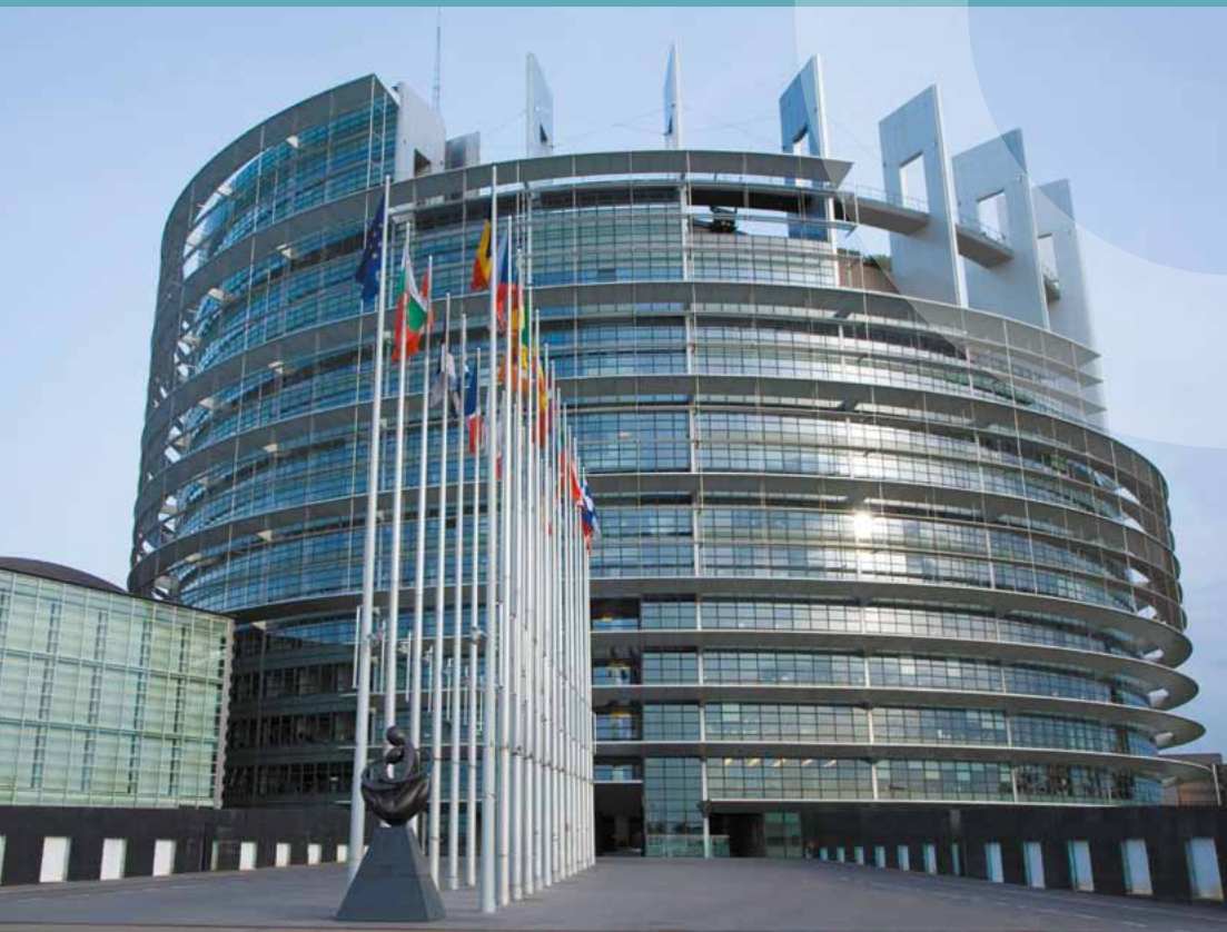
Europäisches Parlament in Straßburg