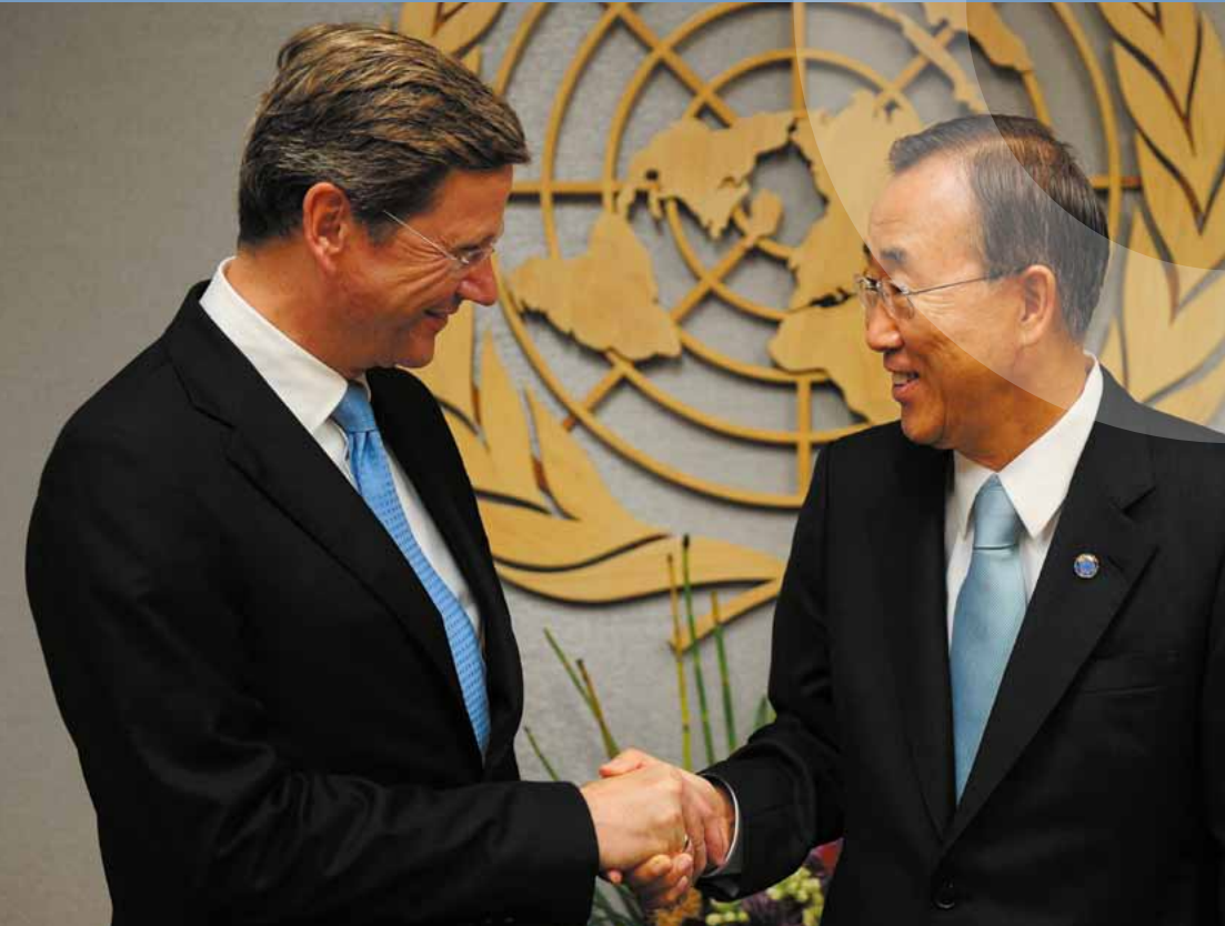
VN-Generalsekretär Ban Ki Moon begrüßt Bundesauswärtigerminister Guido Westerwelle während der 65. Generalversammlung der Vereinten Nationen in New York.