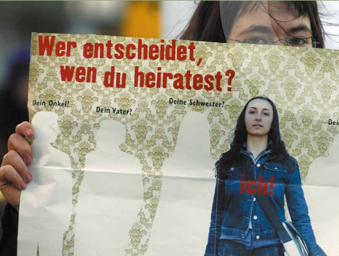
Demonstration zum Internationalen Frauentag in Hamburg

Auf der Grundlage der verfassungsrechtlich garantierten Schutzes der Menschenrechte und der im Grundgesetz verankerten Gleichberechtigung von Männern und Frauen gilt für die Rechte von Frauen und Mädchen in Deutschland durchgängig ein hohes Schutzniveau, das sich sowohl in der Rechtsordnung als auch in der alltäglichen Lebenswirklichkeit von Mädchen und Frauen widerspiegelt.