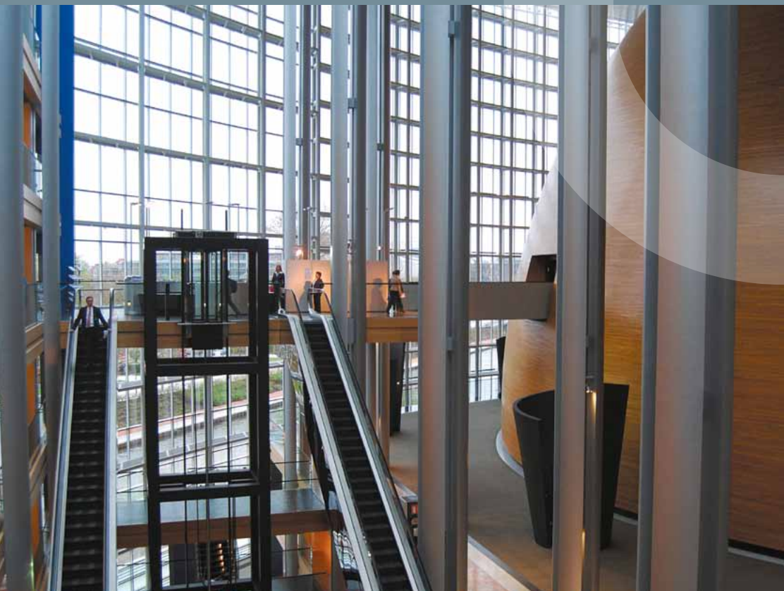
Innenansicht des Europarats in Straßburg

Der Europarat mit seinen mittlerweile 47 Mitgliedstaaten (dies sind alle Staaten Europas außer Belarus und Kosovo) tritt seit seiner Gründung 1949 für die Förderung der Menschenrechte, der pluralistischen Demokratie und der Rechtsstaatlichkeit ein. Schwerpunkte seiner Tätigkeit sind die Weiterentwicklung und die effektive Kontrolle des Menschenrechtsschutzes, der Rechtsstandards und der demokratischen Strukturen in den Mitgliedstaaten. Der Europarat hat hierfür ein einzigartiges Instrumentarium von Rechtsnormen und Mechanismen zur Kontrolle ihrer Umsetzung geschaffen. Die Parlamentarische Versammlung und das Ministerkomitee überprüfen, wie die Mitgliedstaaten ihre mit Beitritt zum Europarat übernommenen Verpflichtungen einhalten. Darüber hinaus verfügen auch verschiedene Europa- ratsübereinkommen mit Menschenrechtsbezug über ein Überwachungssystem. Es besteht aus der Berichtspflicht der Vertragsstaaten, der Beratung des eingereichten Staatenberichts durch einen Ausschuss unabhängiger Sachverständiger und der Weiterleitung des Berichts mit Empfehlungen an das Ministerkomitee, das seinerseits Empfehlungen an den berichtenden Staat abgibt. Das Monitoring-System des Europarats soll anhand nachstehend aufgeführter Einrichtungen bzw. Übereinkommen illustriert werden: