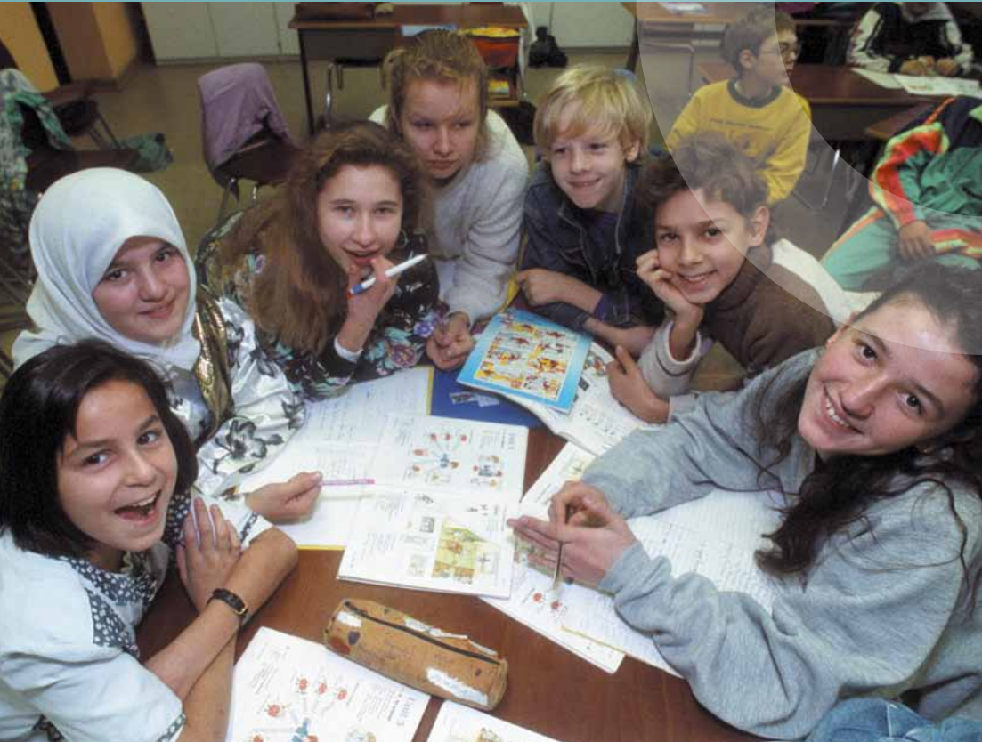
Schülerinnen und Schüler der Hostato-Schule in Frankfurt am Main. Die Schule wird von Kindern aus 21 Nationen besucht.

Das kinderpolitische Handeln der Bundesregierung folgt der Überzeugung, dass Kinder Träger eigener Rechte sind, die es im Hinblick auf die Würde des Kindes auf allen Ebenen zu achten und zu fördern gilt. Das Grundgesetz anerkennt Kinder wie Erwachsene als Grundrechtsträger. Die Kinderrechte sind Teil der allgemeinen Menschenrechte, zu deren Achtung sich die Bundesregierung gemeinsam mit den EU-Partnern im Rahmen internationaler und europäischer Verträge, insbesondere dem VN-Übereinkommen über die Rechte des Kindes von 1989 und seiner zwei Fakultativprotokolle, verpflichtet hat. Zudem setzt sich Deutschland für die Schaffung eines Individualbeschwerdeverfahrens zu dem Übereinkommen über die Rechte des Kindes ein. Auch der am 13. Dezember 2007 unterzeichnete Vertrag von Lissabon enthält eine ausdrückliche Bestimmung zum Schutz der Rechte des Kindes (neuer Artikel 3 Absätze 3 und 5 EUV). Kinderrechte sind Menschenrechte. Ihrem Schutz und ihrer Förderung fühlt sich die Bundesregierung in besonderer Weise verpflichtet.