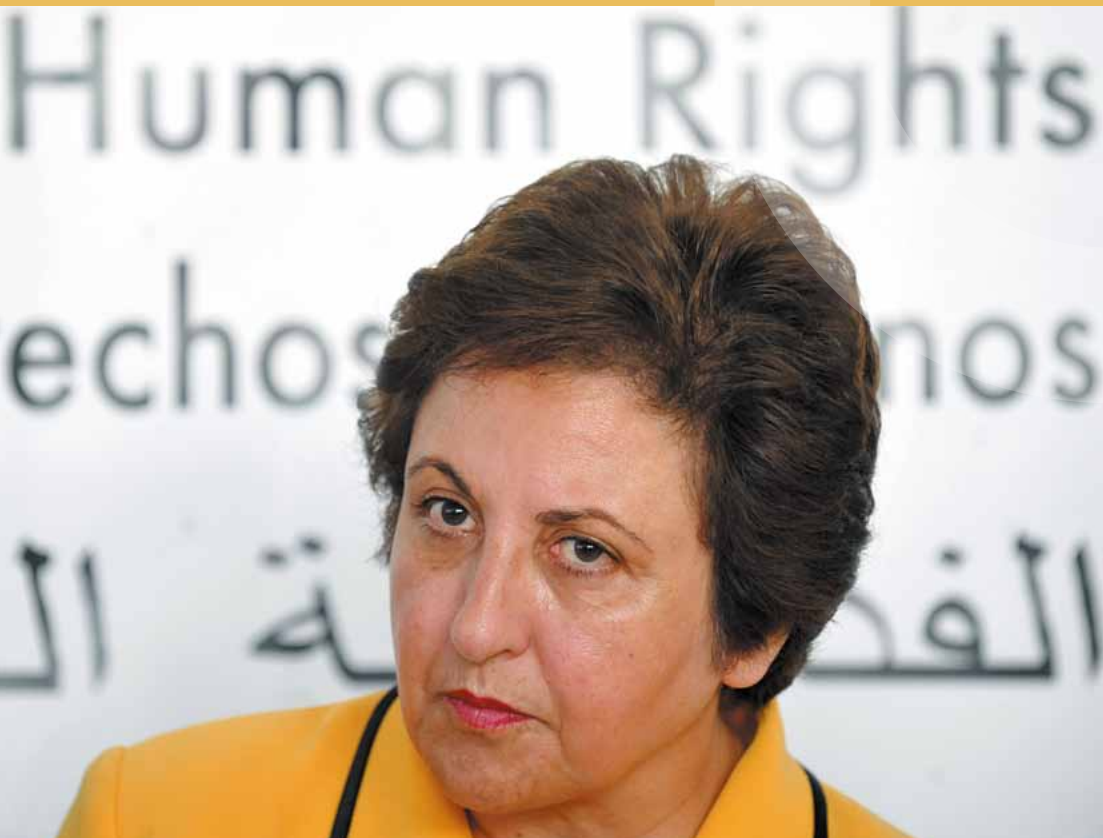
Die iranische Friedensnobelpreisträgerin Shirin Ebadi bei einer Rede in Brüssel zur Lage der Menschenrechte im Iran