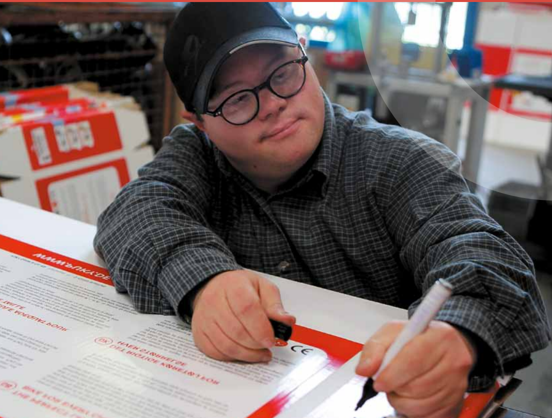
Mitarbeiter mit Downsyndrom eines deutschen Herstellers für Kinderfahrzeuge