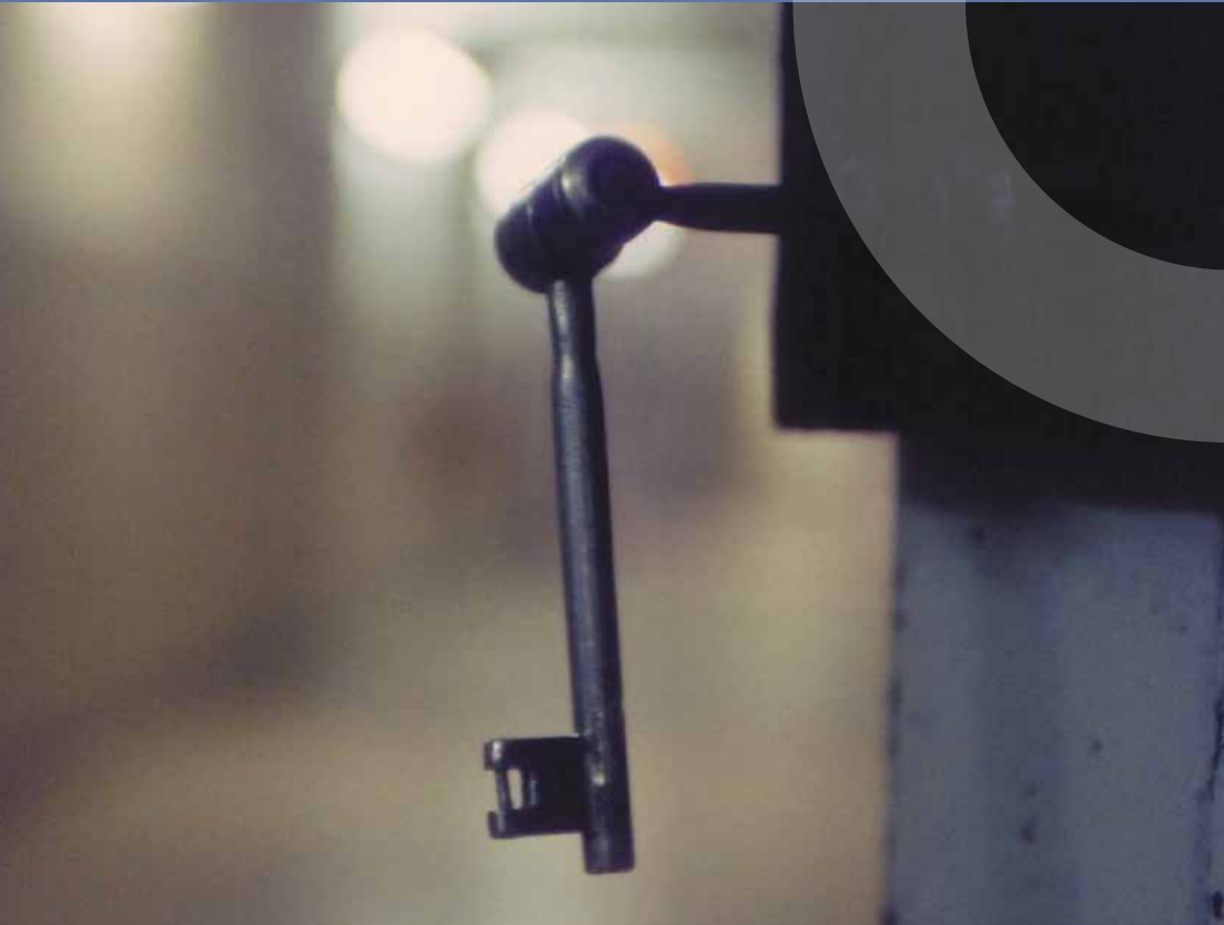
Bild aus der Cedenktstätte Stasi-Gefängnis Hohenschönhausen in Berlin

Deutschland ist Vertragsstaat der wesentlichen Menschenrechtspakete. Es hat umfangreiche Verpflichtungen zum Schutz der Menschenrechte übernommen und internationalen Kontrollorganen Befugnisse eingeräumt. Von besonderer Bedeutung ist dabei der Europäische Gerichtshof für Menschenrechte (EGMR), der die Einhaltung der Europäischen Konvention zum Schutz der Menschenrechte und Grundfreiheiten (EMRK) überwacht.