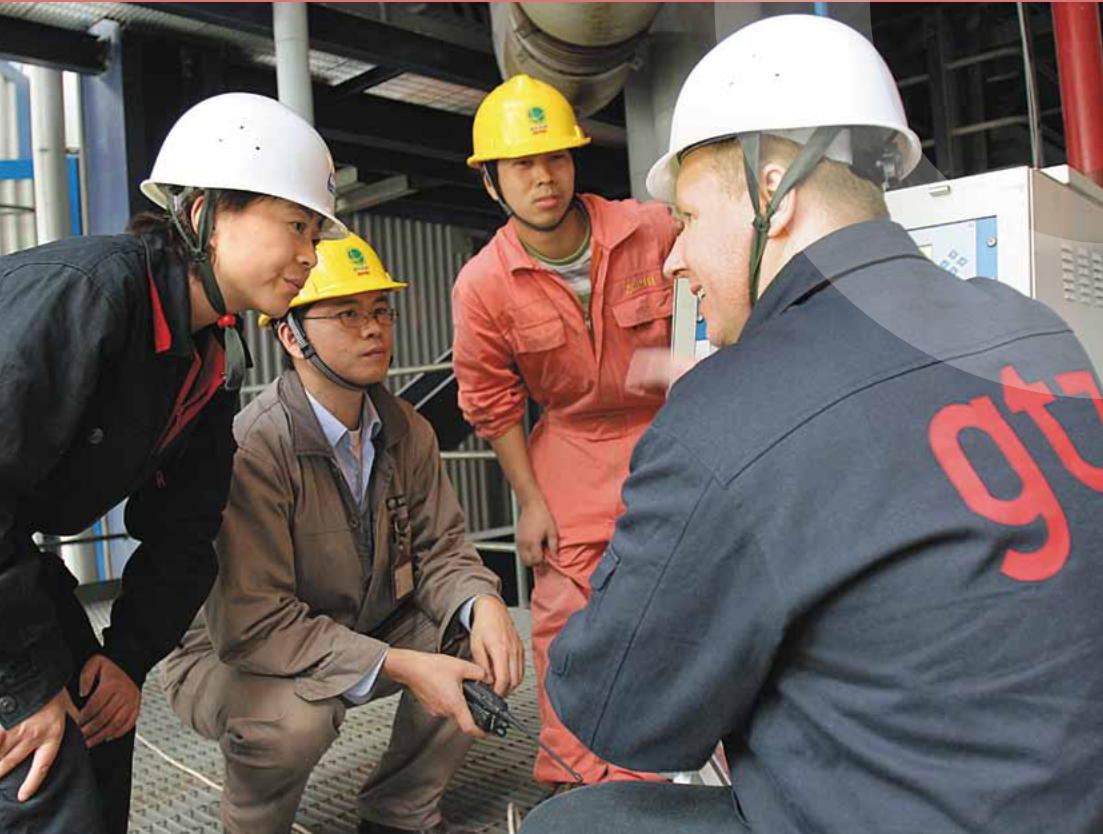
Energieberater der Deutschen Gesellschaft für Technische Zusammenarbeit in China

Seit 2004 setzt das Bundesministerium für wirtschaftliche Zusammenarbeit und Entwicklung (BMZ) seine Selbstverpflichtung zu einem Menschenrechtsansatz um, das heißt zu einer systematischen Ausrichtung der entwicklungspolitischen Zusammenarbeit (EZ) an den Menschenrechten und menschenrechtlichen Prinzipien. Mit der Fortschreibung des entwicklungspolitischen Aktionsplans für Menschenrechte 2008–2010 unterstreicht das BMZ die hohe Bedeutung der bürgerlichen, politischen, wirtschaftlichen, sozialen und kulturellen Menschenrechte für eine erfolgreiche Entwicklungspolitik. Ziel ist es, die deutsche EZ in allen Partnerländern und in allen Sektoren systematisch an den Menschenrechten und menschenrechtlichen Prinzipien zu orientieren. Ob im Schwerpunkt Wasser, Bildung, Gesundheit, der Umweltpolitik oder in der Zusammenarbeit mit der Wirtschaft: Die Menschenrechte sollen in der entwicklungspolitischen Praxis wie in den Zielen und Strategien der Programme Orientierung sein und ihre Wirkung entfalten. Zusätzlich zu diesem Querschnitts-Ansatz stärkt das BMZ durch spezifische Menschenrechtsvorhaben benachteiligte Gruppen in der Wahrnehmung ihrer Rechte, z.B. Frauen, Kinder, Jugendliche, ethnische Minderheiten oder Menschen mit Behinderung.