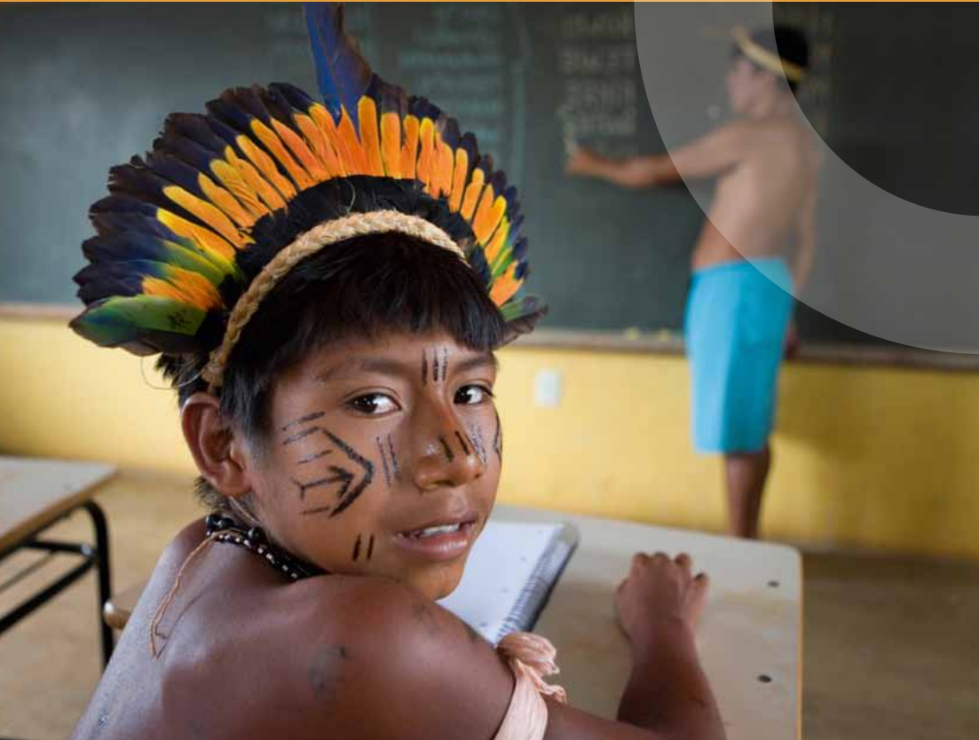
Xingu Indianer im Amazonasgebiet, Brasilien

Die in etwa 70 Staaten lebenden, rund 5.000 indigenen Völker mit insgesamt mehr als 350 Millionen Menschen repräsentieren 4 Prozent der Weltbevölkerung. Dennoch bleibt Personen indigenen Hintergrundes die politische und gesellschaftliche Teilhabe in zahlreichen Ländern ganz oder teilweise verwehrt. So kam bereits 1953 eine Studie der Internationalen Arbeitsorganisation (ILO) zu dem Ergebnis, dass „der Lebensstandard indigener Bevölkerungen in unabhängigen Staaten in der Regel extrem niedrig liegt und in der Mehrheit der Fälle noch beträchtlich unter dem der bedürftigsten Schichten der nicht-indigenen Bevölkerung“. Der Schutz der Menschenrechte von Indigenen bleibt eine schwierige Herausforderung. Fragen bezüglich der Rechte von Indigenen betreffen vor allem Land und Territorium, Umwelt und natürliche Ressourcen, rechtliche Gleichstellung, Sprache, Kultur und Bildung, Armut, Gesundheitsvorsorge, politische Partizipation und Autonomie und das Recht auf Selbstbestimmung. Auch sind sie den Auswirkungen der Globalisierung und des Klimawandels besonders ausgesetzt. Das Kernproblem bilden Diskriminierung und Marginalisierung. Das Übereinkommen Nr. 169 der Internationalen Arbeitsorganisation (IAO/ILO) über eingeborene und in Stämmen lebende Völker aus dem Jahr 1989 ist das einzige internationale Vertragswerk, das einen umfassenden Schutz der Rechte indigener Völker zum Gegenstand hat.