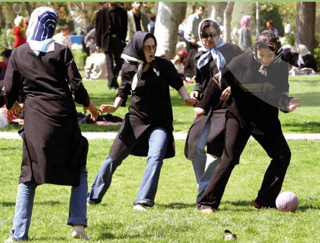
Junge iranische Frauen spielen Fußball in einem Park in Teheran

Die Verbesserung der auf vielfache Weise eingeschränkten Menschenrechtssituation von Frauen ist ein zentrales Element der Menschenrechtspolitik der Bundesregierung in der Außen- und Entwicklungspolitik.