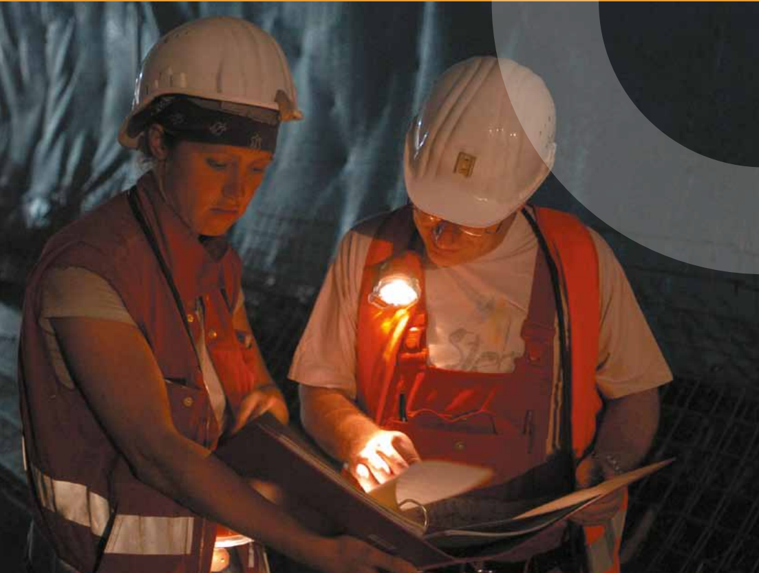
Bauarbeiterin und Bauarbeiter in Deutschland

Schon die Allgemeine Erklärung der Menschenrechte (1948) führt in den Artikeln 23 bis 27 wirtschaftliche, soziale und kulturelle Rechte auf (u. a. Recht auf Bildung, Arbeit, angemessenen Lebensstandard, einschließlich Ernährung, ärztliche Versorgung und Wohnen), die sog. WSK-Rechte. Mit dem Internationalen Pakt über wirtschaftliche, soziale und kulturelle Rechte („Sozialpakt“) wurde 1966 – parallel zur Verabschiedung des Internationalen Pakts über bürgerliche und politische Rechte – das universelle Menschenrechtsinstrument zu den WSK-Rechten geschaffen. Die Bundesrepublik Deutschland hat den Pakt 1973 ratifiziert, in Kraft getreten ist er 1976. Mit dem Sozialpakt verpflichteten sich die Vertragsstaaten, die in ihm enthaltenen Rechte zu achten, zu schützen und schrittweise zu gewährleisten. Die Rechte sind also ihrer Natur nach darauf angelegt, durch den Gesetzgeber ausgefüllt zu werden; wann WSK-Rechte dem einzelnen Bürger einklagbare Rechte verleihen, ist je nach Art der Verpflichtung und im Hinblick auf den Kontext des Einzelfalls zu entscheiden.