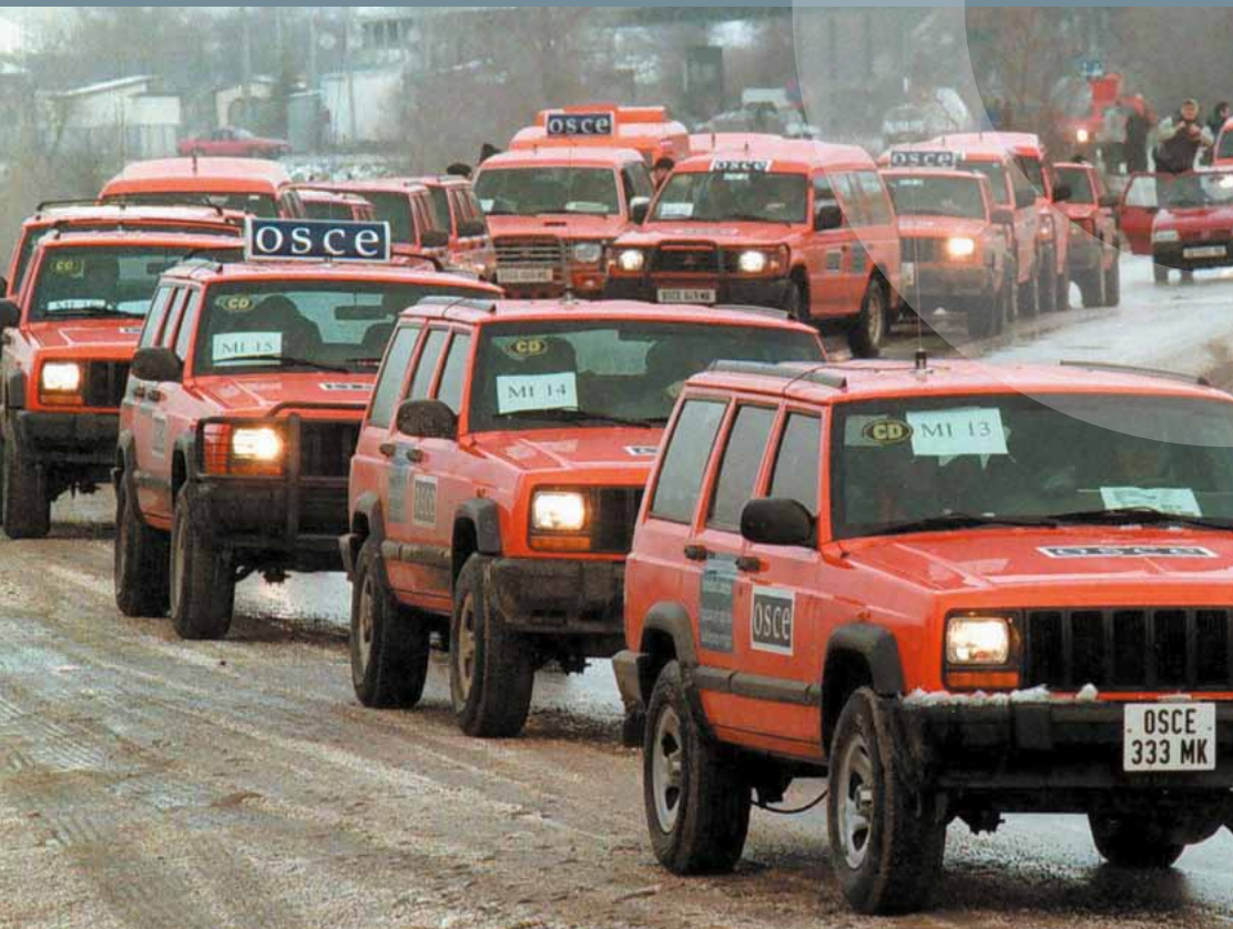
OSZE-Beobachtermission im Einsatz in Serbien