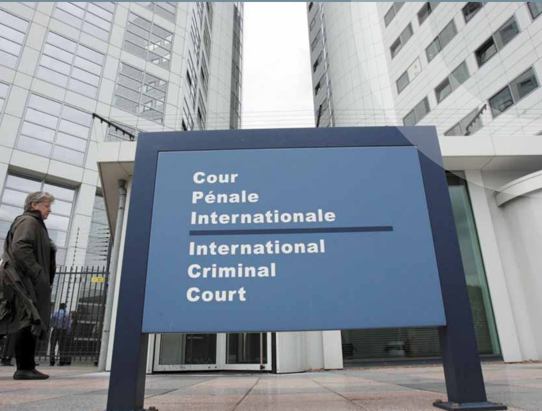
Internationaler Strafgerichtshof in Den Haag

Der IStGH hat Gerichtsbarkeit für die schwersten Verbrechen, welche die internationale Gemeinschaft als Ganzes berühren, nämlich Völkermord, Verbrechen gegen die Menschlichkeit und Kriegsverbrechen. Wer an solchen gravierenden Völkerrechtsverletzungen beteiligt ist, muss sich nach dem Römischen Statut vor einem unabhängigen Gericht verantworten und kann sich nicht auf eine amtliche Funktion oder auf Immunität berufen. Der Gründungsvertrag des IStGH, das „Römische Statut“, will „der Straflosigkeit der Täter ein Ende setzen und so zur Verhütung solcher Verbrechen beitragen“ (Präambel).