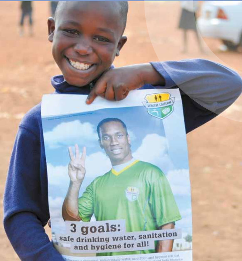
Afrikanisches Kind mit Poster der WASH United Kampagne